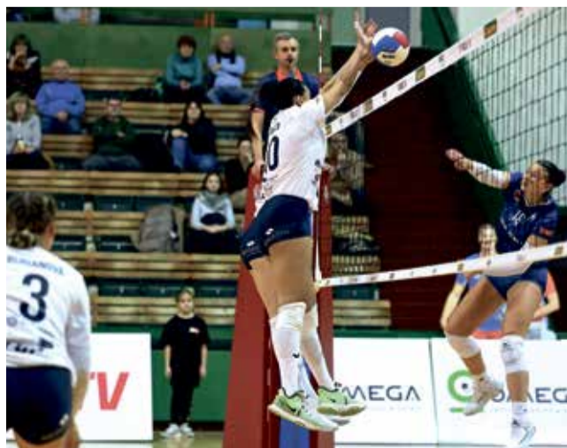
Volejbalistky VK Šantovka Olomouc si doma v derby poradily s Přerovem.