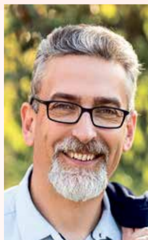
Mirek Žbánek primátor

Ptejte se vedení města Olomouce na e-mailové adrese otevrenaradnice@hanackyvecernik.cz a my Váš dotaz necháme zodpovědět!