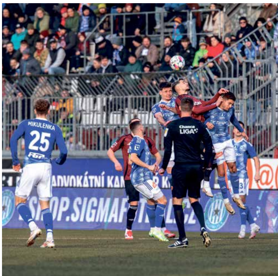
Fotbalisté SK Sigma Olomouc měli na dosah vítězství nad Spartou. I přes smolnou prohru se stále drží v první šestce tabulky.