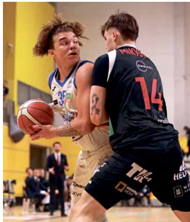
Basketbalisté BK Olomoucko si užívají dosud nejlepší sezónu v klubové historii.