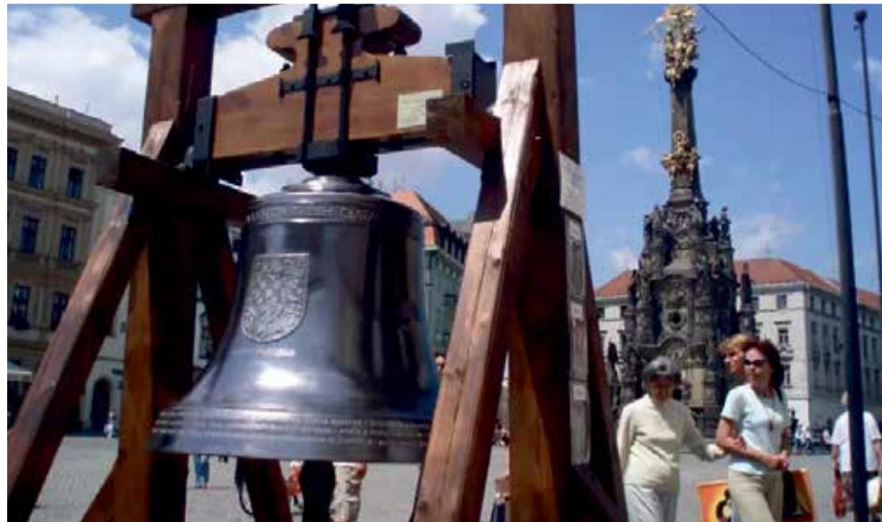
Zvon sv. Michal byl před umístěním v chrámu v roce 2008 vystaven na Horním náměstí

V metropolitní katedrále svatého Václava je také celá řada zvonů. Ve velké jižní věži je zvonice, kde se nachází zvon sv. Václav. Jde o vůbec největší zvon na Moravě a druhý největší v celé České republice. Je 242 cm široký a 179 cm vysoký a má hmotnost 8 156 kilogramů. Vyrobili jej místní zvonářského řemesla v roce 1827 ve Vidni. Dále zde je téměř