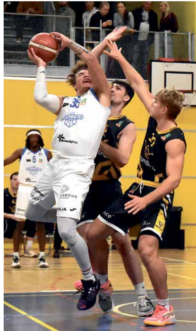
Basketbalisté BK Olomoucko bojovali s aktuálním lídrem tabulky Kooperativa NBL.

„Přiznám se, že ani nevím, co se v zápase všechno dělo. Za poločas si od jednoho hráče necháme dát sedmadvacet bodů, pak v závěru ztratíme náskok sedmi bodů, když se projeví naše bolest, kterou jsou trestné hodiny. Naštěstí jsme dokázali ze hry dostat několik hráčů a v závěru nastavení se projevila naše širší rotace. Z vítězství máme velkou radost. Z prvních sedmi zápasů jsme chtěli pět nebo šest, máme všechny, což je jako sen,“ řekl Jan Čech, trenér Pisku. ■