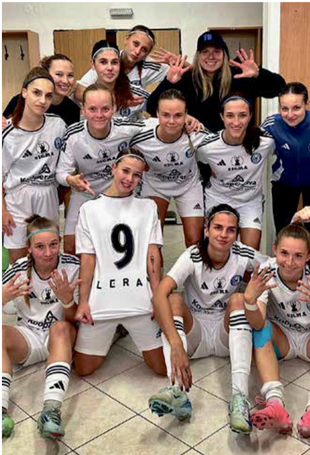
Fotbalistky SK Sigma Olomouc pokračují ve skvělých výkonech.