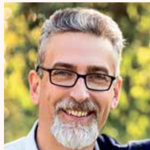
Mirek Žbánek primátor

Ptejte se vedení města Olomouce na e-mailové adrese otevrenaradnice@hanackyvecernik.cz a my Váš dotaz necháme zodpovědět!